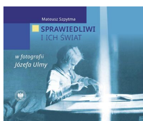
Sprawiedliwi i ich świat